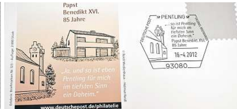
Umschlag mit dem Entwurf des Sonderstempels Papst Benedikt XVI.